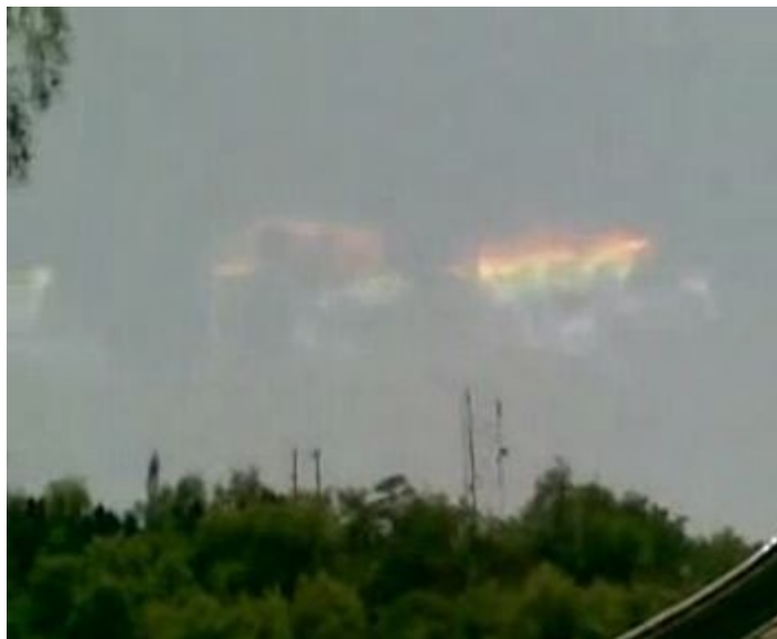
Luci telluriche fotografate in Cina prima di un terremoto

possa determinarne l'esplosione (terremoto) in questi casi della caffettiera o della pentola.